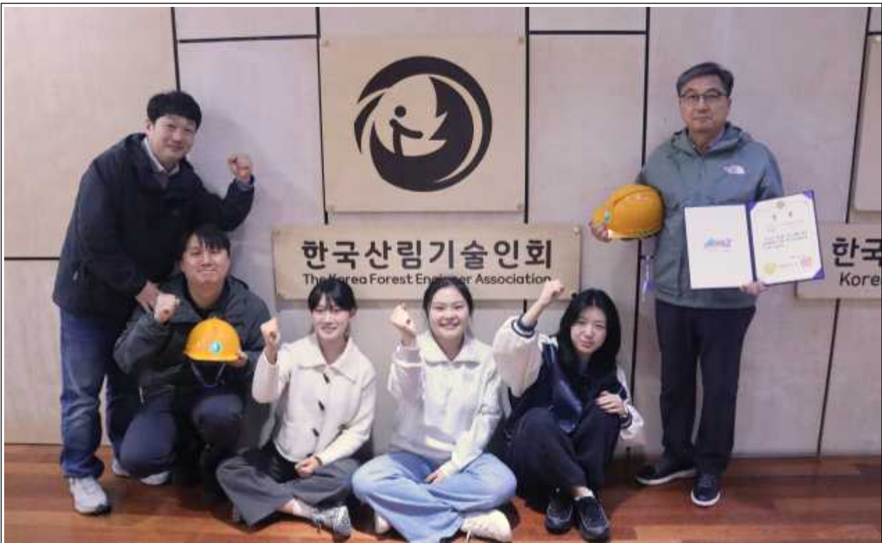
사진 = 8일 한국산림기술인회에 따르면 한국산림기술인교육원 직원들이 대전소방본부 주관 ‘제13회 시민 심폐소생술 경연대회’에서 우수상을 수상했다.

- 한국산림기술인교육원 직원 참여 ... 산림 작업 현장 응급처치 선보여 -