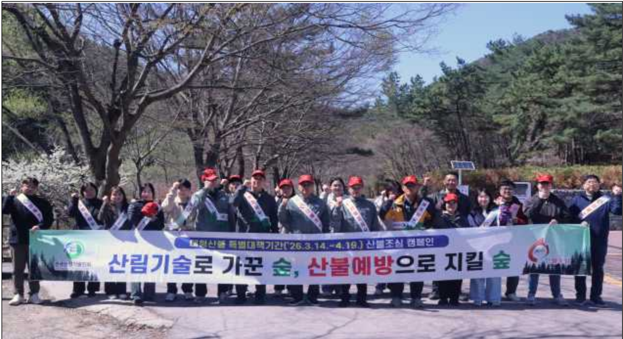
'산림기술로 가꾼 숲, 산불예방으로 지킬 숲' 산불조심 캠페인 참여자들이 7일 대전 계룡산 국립공원 수통골에서 캠페인을 마친 뒤 기념촬영을 하고 있다.